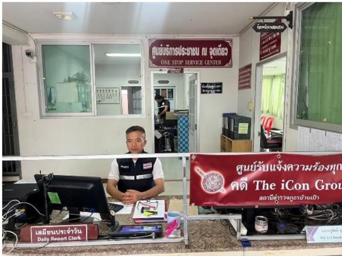
ภาพป้ายประชาสัมพันธ์จุดบริการ