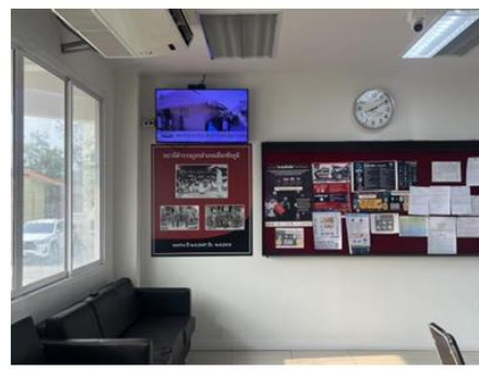
โทรทัศน์สถานีตำรวจแห่งชาติ POLICE TV