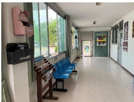
ที่พักนั่งรอสำหรับผู้มาใช้บริการ