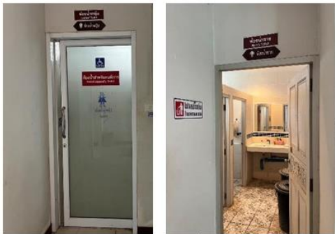
ห้องสุขา แยกชายหญิงทั้งสองฝั่งอาคาร