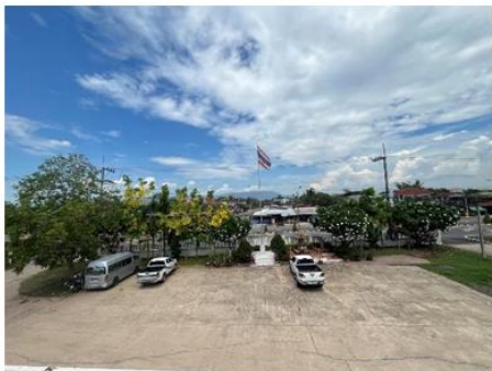
ที่จอดรถสำหรับประชาชนบริเวณด้านหน้า สภ.