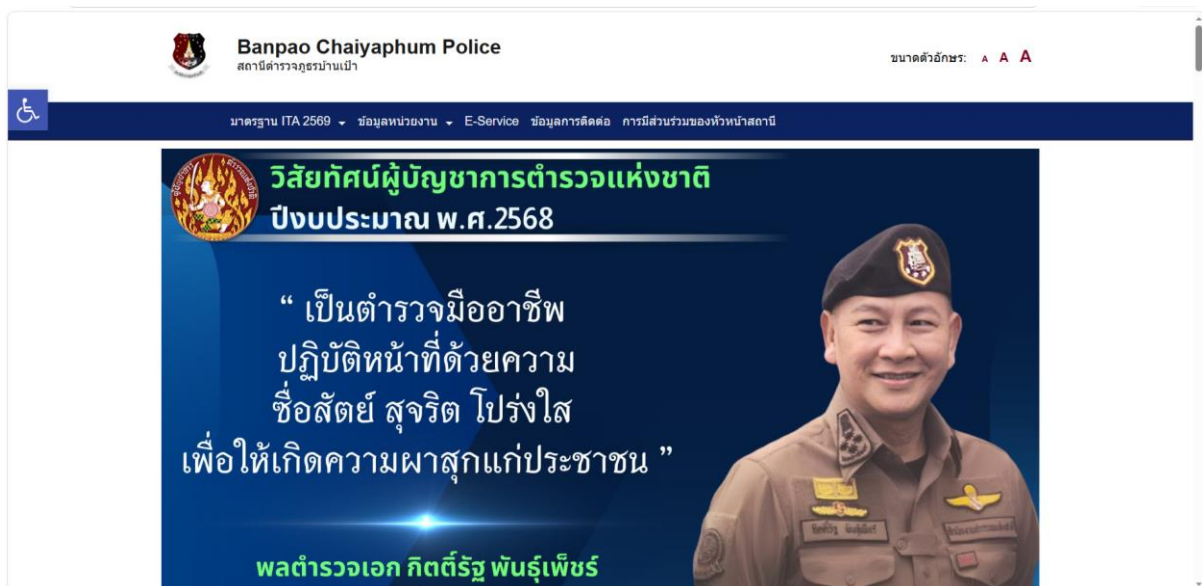
ภาพหน้าแรกเว็บไซต์ สภ.บ้านเป้า ผลการปฏิบัติงานของแต่ละสายงานประจำเดือน