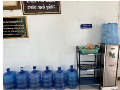
จุดบริการน้ำดื่มสำหรับผู้มาใช้บริการ