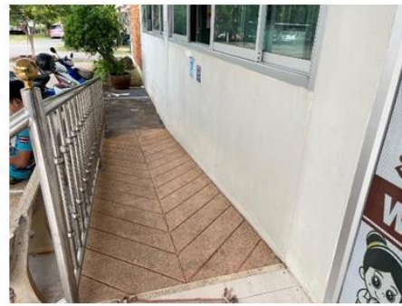
ทางลาดสำหรับผู้พิการ